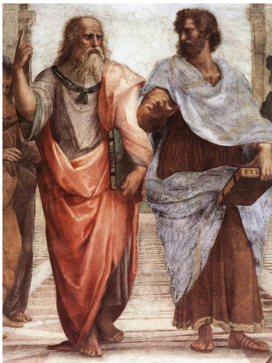
Rafaël Santi, Szkoła ateńska (fragment), 1509 – 1511, Stanze della Segnatura, Watykan

Poniżej jest fragment słynnego malowidła ściennego Rafaela z początku XVI w. „Szkoła ateńska”. W centrum malowidła są dwaj najsłynniejsi filozofowie starożytności: Platon i Arystoteles.